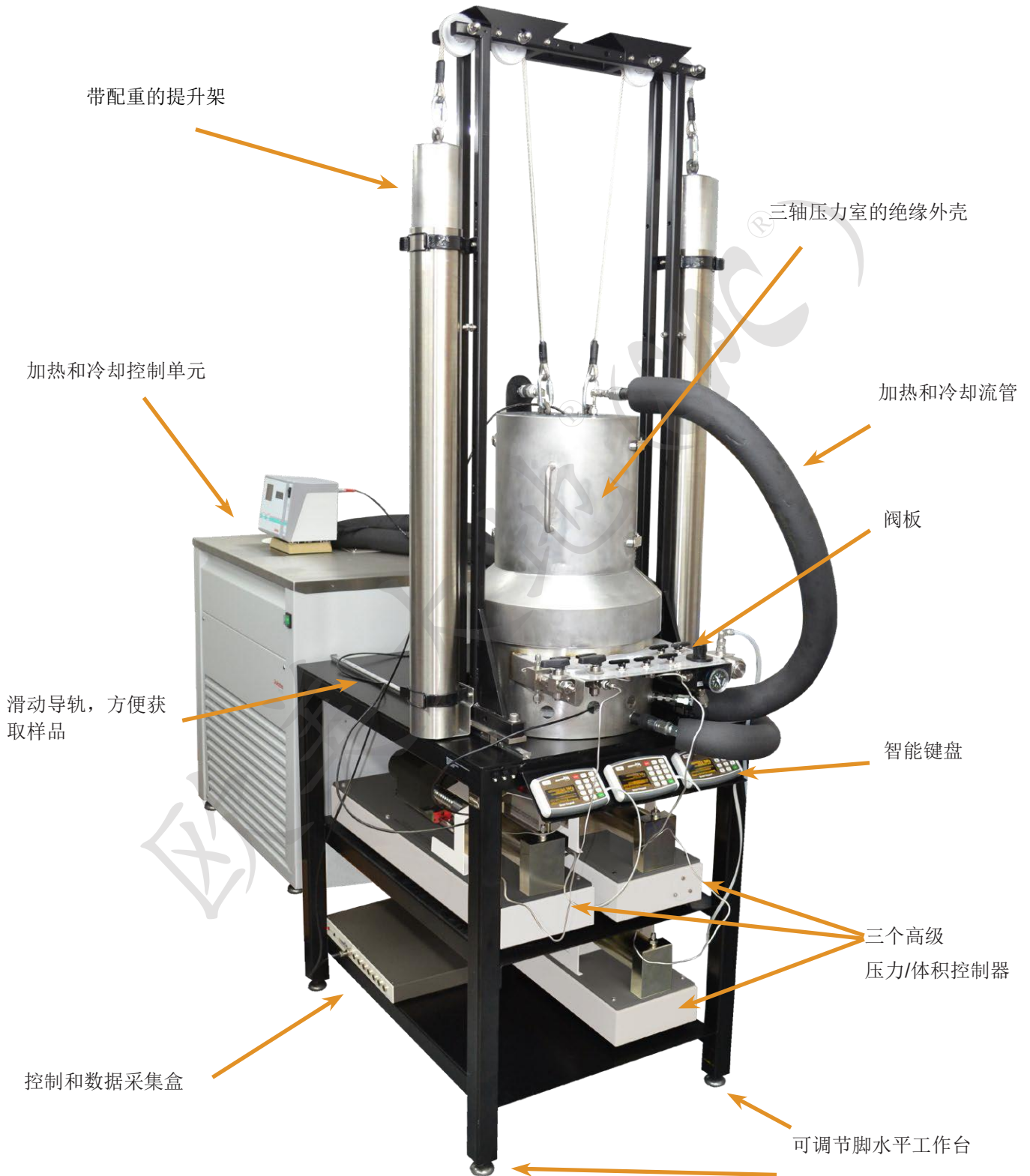
图 1. ETTS 的主要特性